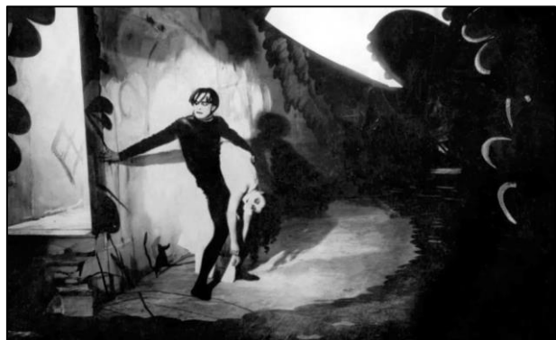
Wiene: Dr. Caligari

A német császárság kegyetlenségét próbálja burkoltan bemutatni. Dr. Caligari a hipnotizőr orvos szimbolizálja a császárságot. Cesare a médiuma, a német katonaság megtestesítőjeként tudat alatt kap parancsot a gyilkolásra.