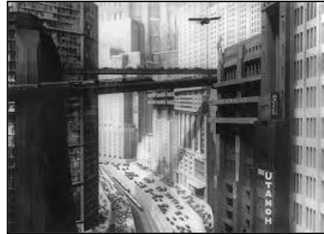
Lang: Metropolis 1927

Fritz Lang Metropolis a egy jövőbeli várost mutat be, ahol a gazdagok felhőkarcolókban élik gondtalan életüket, amit a föld üregeiben tengődő munkások biztosítanak számukra. Képi megoldásait ma is sok film használja, pl. az űrült tudós által életre keltett robot, a sokemeletes házak között több szinten közlekedő gépek.